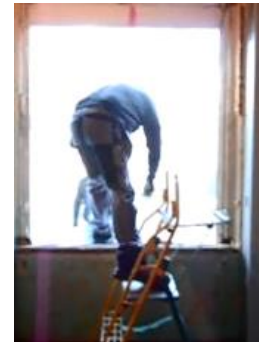
Risque de chute