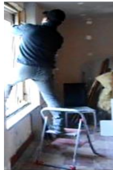
Posture instable avec torsion